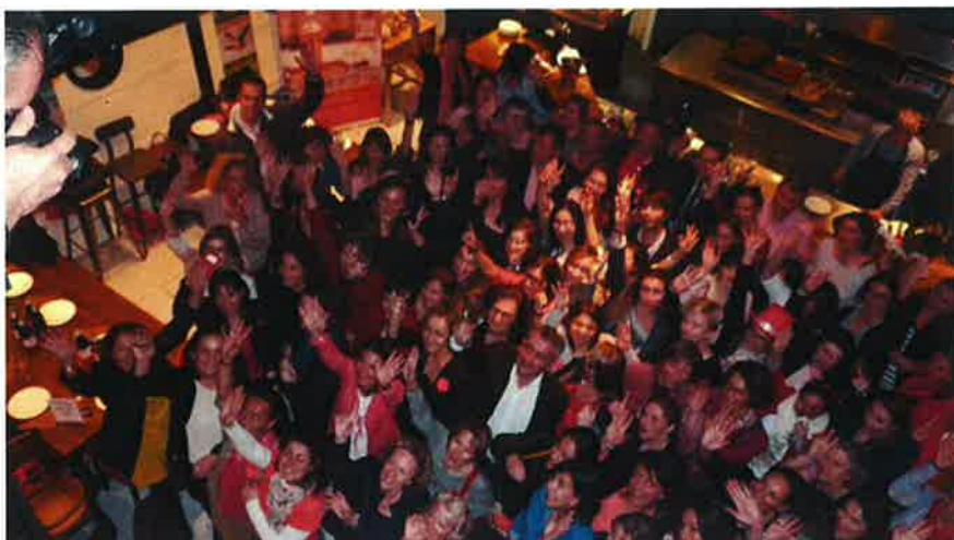
80 femmes avaient dégusté en mars dernier à la Brasserie Bordelaise et décerné le palmarès des oscars de l'été

Les Oscars Bordeaux Rosé seront ainsi mis en en avant: ce sont les 6 vins primés en mars dernier par un jury 100% féminin composé de viticultrices, sommelières, journalistes, blogueuses et passionnées qui ont choisi leurs coups de coeur, destinés à devenir les incontournables de l'été.