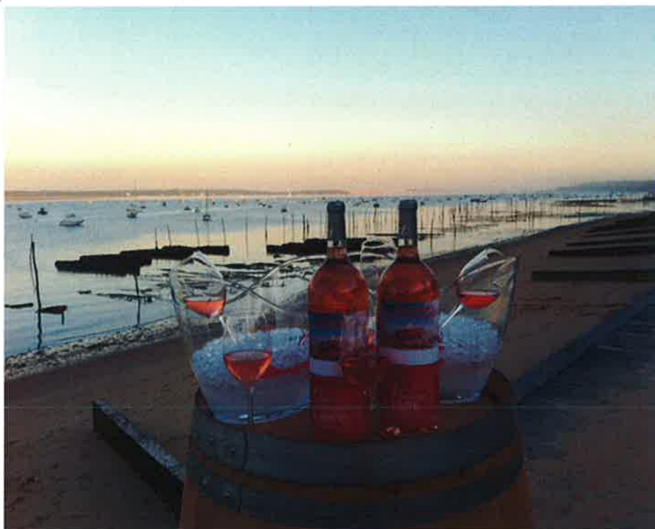
Les Rosés passent tout l'été sur le Bassin d'Arcachon @ Planète-Bordeaux

C'est sa tournée...la tournée du syndicat des Bordeaux et Bordeaux Supérieur. Il organise tout l'été une opération dans les restaurants du bassin d'Arcachon pour mieux faire connaître la production de ses viticulteurs. L'an dernier l'appellation avait enregistré un record de production avec une augmentation de + 39%.